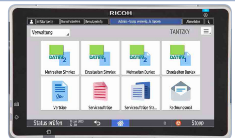
Direkte Auswahl des Belegtyps am Multifunktionssystem