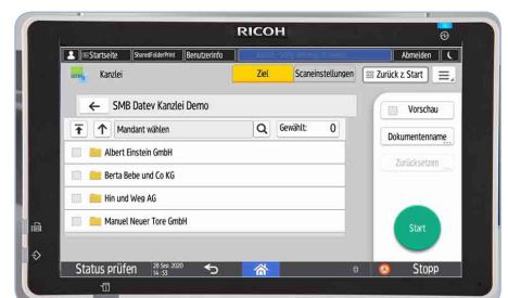
Übernahme der Mandantenstruktur aus DATEV