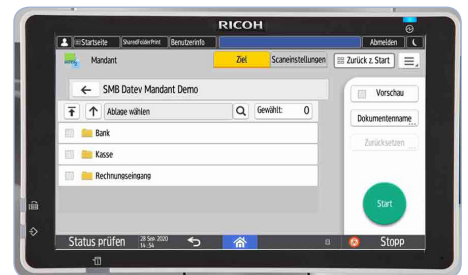
Übernahme der Ablagestruktur aus DATEV